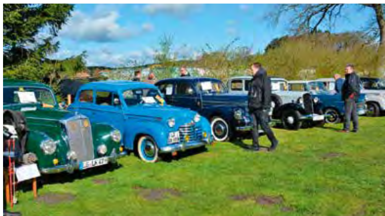
Hochglänzender Chrom wohin das Auge schaut: Hunderte Oldtimer werden erwartet

Neben den in die Jahre gekommenen Schmuckstücken, werden wieder unzählige Händler Altes und Kultiges rund um die betagten Fahrzeuge, LKW, Trecker und Zweiräder auf dem Teilemarkt feilbieten.