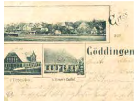
Auf dem oberen Foto sieht man vorn das Wartehäuschen der Bleckeder Kreisbahn in Göddingen

Leider gibt es keine Zeitzeugen mehr, daher ist man auf Postkarten, Fotos, Landkarten und Dokumente angewiesen.