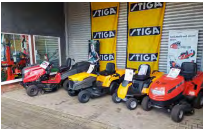
Aufsitzmäher von Stiga oder Efcu für den großen Rasen

Mit dem dieser Tage bevorstehenden kalendrischen Frühlingsanfang beginnt so allmählich auch wieder die Gartensaison. Oft stellt man dabei beim Blick in den Gartenschuppen fest, dass die im Herbst eingelagerten Gartengeräte eine Überholung dringend nötig haben oder gar den Dienst verweigern. Der Rasenmäher springt