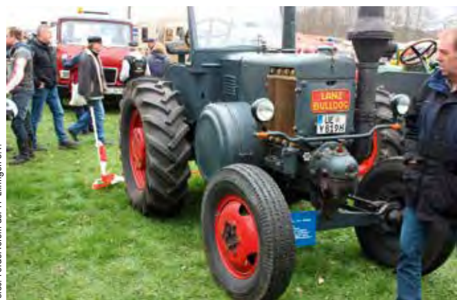
Der Lanz Bulldog ist ein Klassiker beim Oldtimertreffen