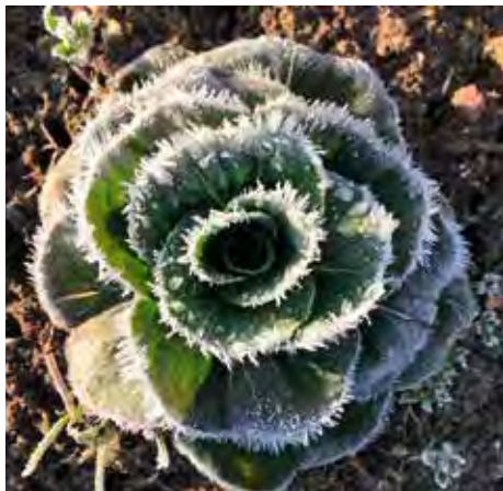
Zichoriensalat der Sorte „Grumolo Verde“ nach einer Frostnacht im März

„Unsere Kunden schätzen es, dass wir immer wieder für Überraschungen sorgen. Ob auf dem Wochenmarkt oder in der Gemüsebox: Wir versuchen unseren Kunden Abwechslung zu bieten und bauen daher auch weniger geläufige Gemüsesorten an. Auch in diesem Jahr haben wir wieder einiges in petto. Unsere Kunden dürfen gespannt sein.“