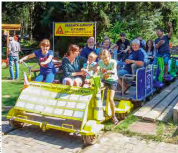
Die Draisine bietet Spaß für die ganze Familie