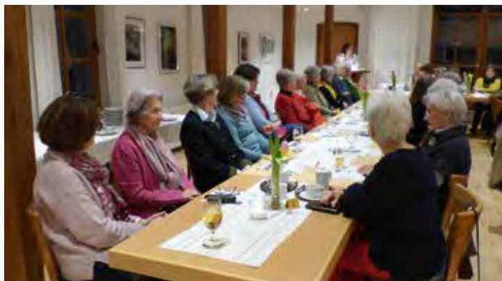
Die Jahreshauptversammlung fand am 10. Februar statt

Die Pflanzgruppe wird auch dieses Jahr wieder dafür sorgen, das Dahlenburg ein wenig bunter und die Beete gepflegt sein werden.