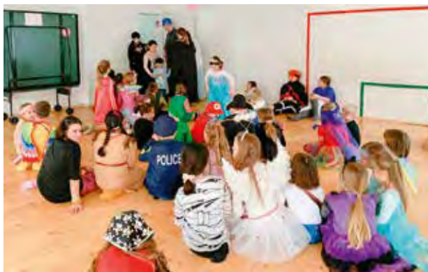
Die besten Kostüme wurden auf der Faschingsparty prämiert

Für den kleinen und auch großen Hunger sowie Durst wurde durch ein großes Buffet gesorgt, zu dem jedes Kind etwas mitgebracht hatte. Zusammen wurde viel gelacht,