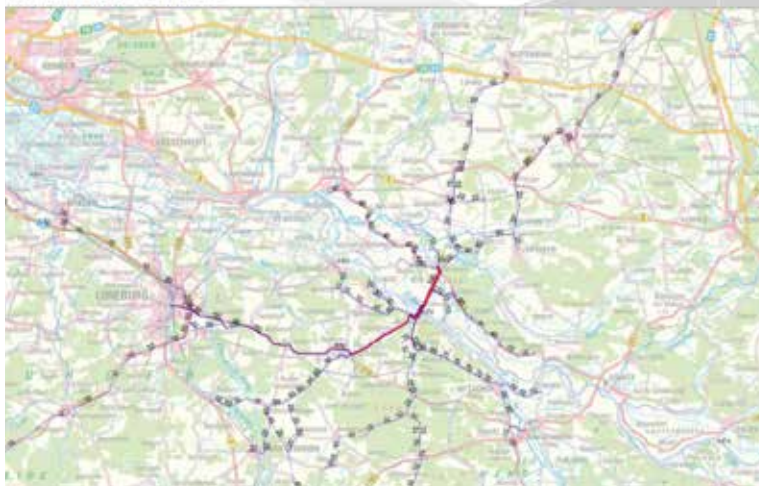
4 - Stromverfolgung: Elbquerender Kfz-Verkehr im Raum Darchau – Neu Darchau Planfall 2030 – Elbbrücke