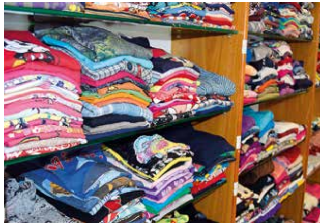
Große Auswahl im Kinderregal

ein Projekt unter dem Dach der AWO-Bleckede. Alle Mitarbeiter und Helfer arbeiten ehrenamtlich. Bisher konnten wir Räume der Stadt Bleckede für uns kostenlos nutzen. Der