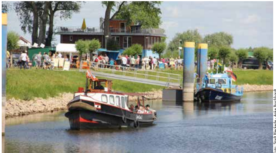
Suhr und Cons2 bietet 2022 wieder Hafenrundfahrten an