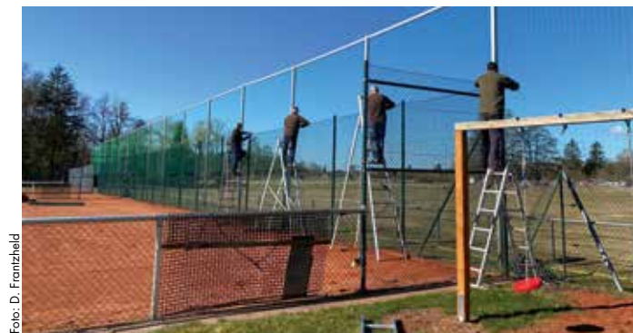
Sanierung der Zaunanlage beim TC Dahlenburg

60 Jahre nach der Unterzeichnung des Elysée-Vertrags ist die deutsch-französische Freundschaft zur Selbstverständlichkeit geworden. In der Ausstellung „La carcade franco-allemande“ von der Helmut Schmidt Medien GmbH werden in 50 Karikaturen die deutsch-französischen Beziehungen von 1963 bis heute auf kritische, satirische oder sarkastische Weise, immer aber humorig beschrieben. Deutsche und französische Künstler widmen sich den politischen Größen beider Länder aus den vergangenen fünf Jahrzehnten, von Charles de Gaulle und Konrad Adenauer über Helmut Kohl und François Mitterand bis Nicolas Sarkozy und Angela Merkel. Bei allem Spott und aller Kritik bleibt: die deutsch-französische Freundschaft ist unumkehrbar und beispielhaft für die Welt.