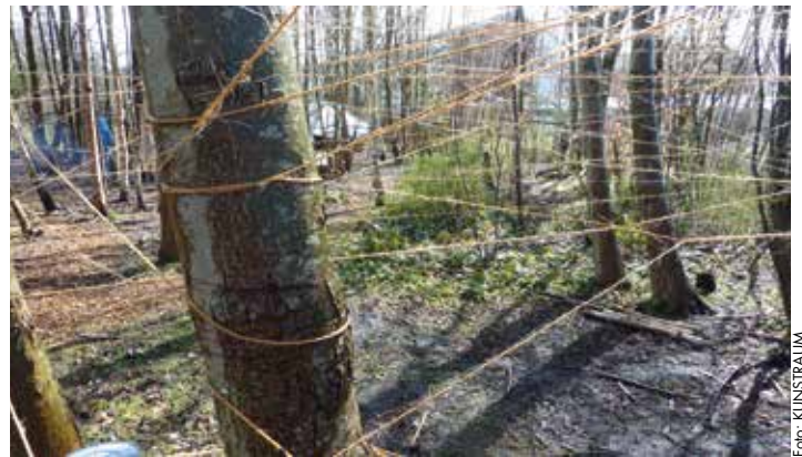
Endlich Unendlich - Ferienaktion im Öffentlichen Garten

Sind 300 m unendlich weit? Kommt darauf an, 300 m hoch in den Himmel ist keine große Entfernung. Bis zu den Wolken, den Sternen oder der Sonne ist es scheinbar unendlich weit. 300 m Band ist aber schon sehr lang. Mit so einer dicken Rolle Band ziehen wir in unserem Garten los. Den Anfang binden wir an einen Baum, rennen zum nächsten Baum drehen eine Runde um ihn herum und schon hängt das Band am Ast eines weiteren Baumes.