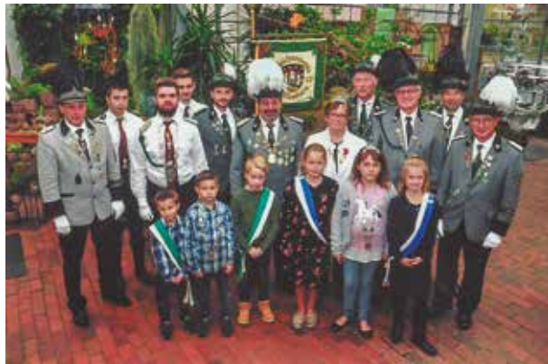
Nach zwei Jahren ohne Schützenfest wird die coronabedingt verlängerte Regentschaft der Königsfamilie 2019 zu Ende gehen

Das Kinderkomitee hat sich wieder zahlreiche Aktivitäten für die Kinder einfallen lassen. Die Erwachsenen können sich in der