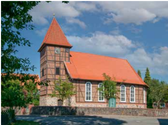
St. Lambertus in Nahrendorf - eine Kirche mit langer Geschichte

12:00 - 17:00 Uhr - „Kunterbunter Kirchplatz“ mit Spiel und Spaß für Groß und Klein und Vorstellung der Vereine