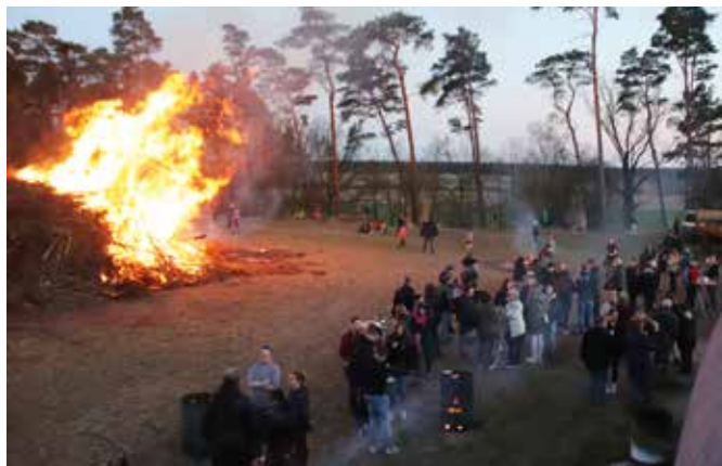
Osterfeuer in Nahrendorf