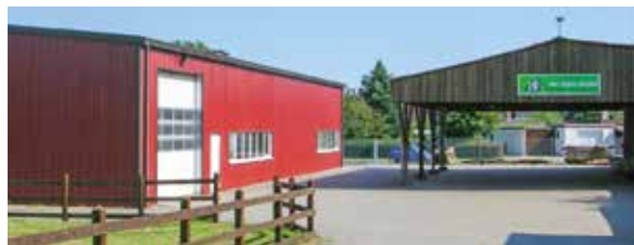
Betriebsgelände in Dahlenburg

Nach 35 Jahren blickt er mit einer gewis-