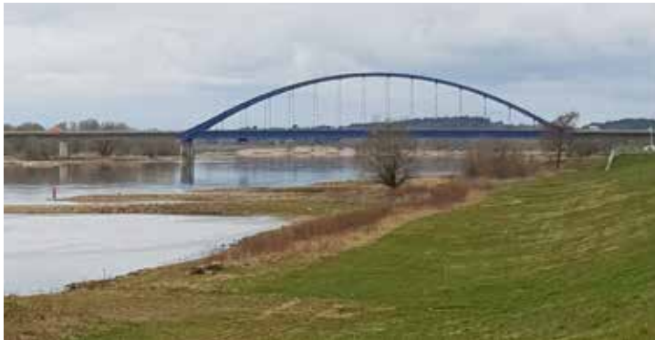
Ähnlich der geplanten Elbquerung bei Neu Darchau: Brücke bei Dömitz

gesellschaftliche, kulturelle und soziale Entwicklung in Südwestmecklenburg und im Nordosten Niedersachsens sowie die Bevöl-