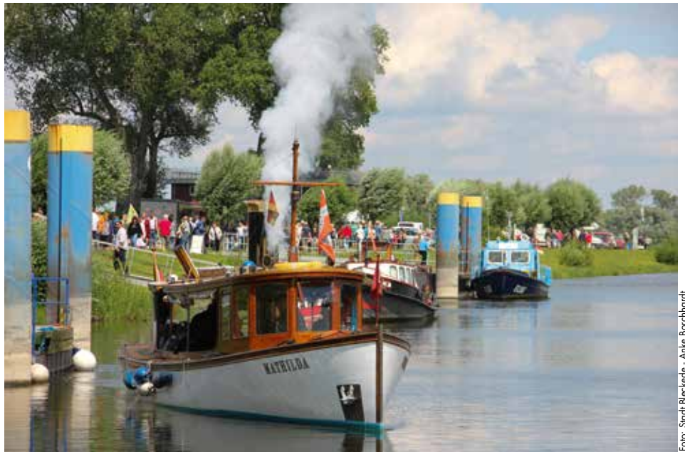
Open-Ship und Hafenrundfahrten beim Bleckeder Hafentag 2022

Das Organisationsteam der Bleckeder Hafentage freut sich auf Sie!