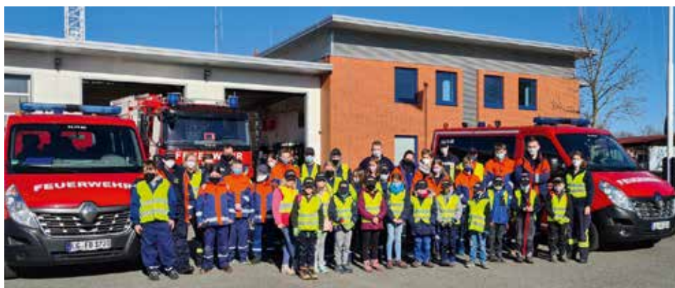
Kinder- und Jugendfeuerwehr Bleckede beim Start der Müllsammelaktion

[ Carsten Schmidt ] Die Müllsammel-Challenge der niedersächsischen Kinder- und Jugendfeuerwehren startete am 19. März auch in Bleckede.