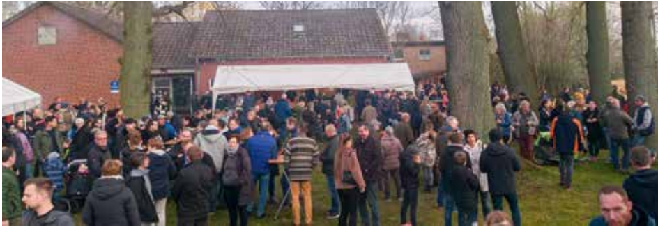
Durst und Hunger nach Geselligkeit - der NDR berichtete am Gründonnerstag live vom Osterfeuer in Barendorf

[ Andreas Bahr ] Endlich wieder Osterfeuer, sagten sich die rund 500 Besucher des Osterfeuers 3.0 am Gründonnerstag in Barendorf.