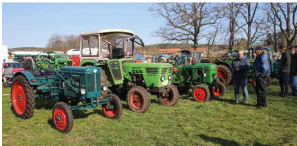
Natürlich gehörte auch das Fachsimpeln unter den angereisten Fahrzeughaltern zum Oldtimertreffen