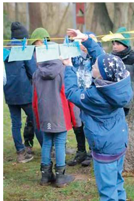
Mit großem Eifer waren die Kinder der Klasse 3c bei der Sache

www.elbtal-grundschule-bleckede.de/draussenschule.html