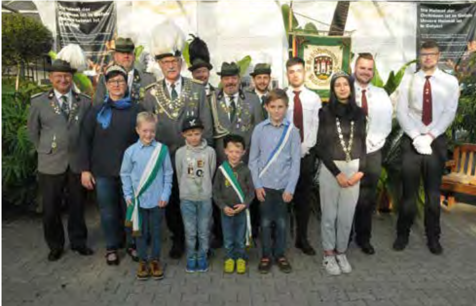
Die Königsfamilie 2022 der Dahlenburger Schützen