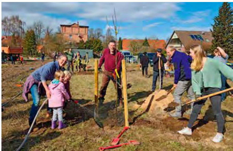
Bei bestem Wetter kamen am 19. März viele Barskamper zusammen, um die Streuobstwiese anzulegen

Weitere Aktionen zur Entwicklung des Projekts, ein Bewässerungssystem durch die Nutzung des Regenwassers vom großen Dach des Saatbaugebäudes, eine Beschilderung für die Bäume und am Eingang zur Wiese, ein Spalier für die Himbeerbüsche, ein Zaun und vieles mehr sind in Planung.