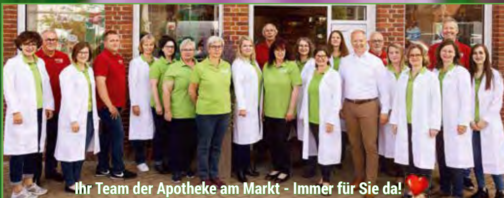
Ihr Team der Apotheke am Markt - Immer für Sie da!