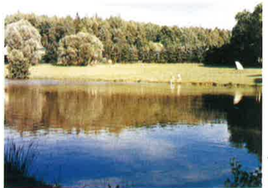
Die herrliche Umgebung entdecken