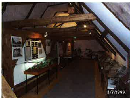
Das Dahlenburger Heimatmuseum bietet auf 3 Ebenen Heimatgeschichte an. Eine gern besuchte Attraktion ist das Diorama von der Schlacht bei der Göhrde.

Die Berichte sollen kurz und informativ gehalten und möglichst mit Fotos untermauert werden. Wir wollen aber auch über unsere Nachbargemeinden berichten wie z.B. über die "kostbare Elbtalaue" oder andere Sehenswürdigkeiten die für unsere Bürger und Gäste interessant sind. Erreichen wollen wir, dass Dahlenburg Aktuell auch für den Fremdenverkehr gezielt eingesetzt wird.