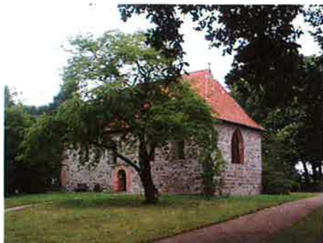
Das Dahlenburger Heimatmuseum in der St. Laurentius-Kapelle an der Lüneburger Landstraße ist schon einen Besuch wert.

Wir möchte mit Dahlenburg AKTUELL allen Interessierten die Möglichkeit geben sich redaktionell zu beteiligen. Berichte sind gefragt, die für alle Bürger und Gäste unserer Samtgemeinde interessant sind. So z.B.: Was kann man unternehmen? Wo findet gerade ein Schützenfest statt? Oder möchten Sie mal in das Dahlenburger Heimatmuseum gehen?