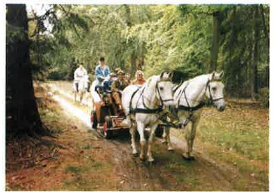
Kutschfahrten durch den Staatsforst Göhrde