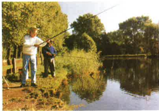
Aktivurlaub beim Angeln