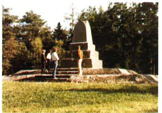
Denkmal der Göhrdeschlacht