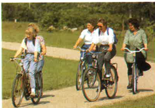
Mit dem Fahrrad die Umgebung erkunden