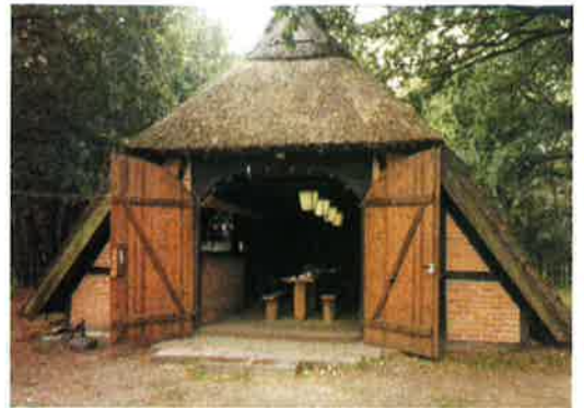
Schafstall in Ventschau