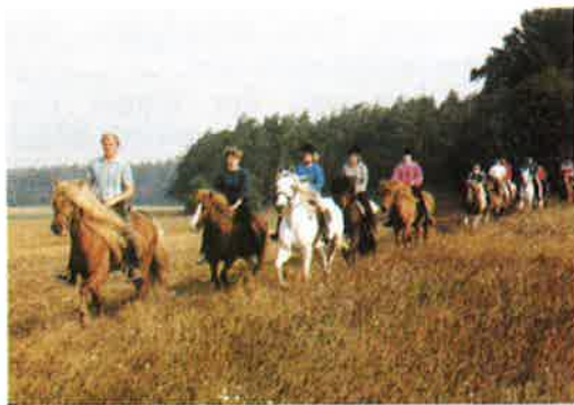
Reiten und die Landschaft genießen